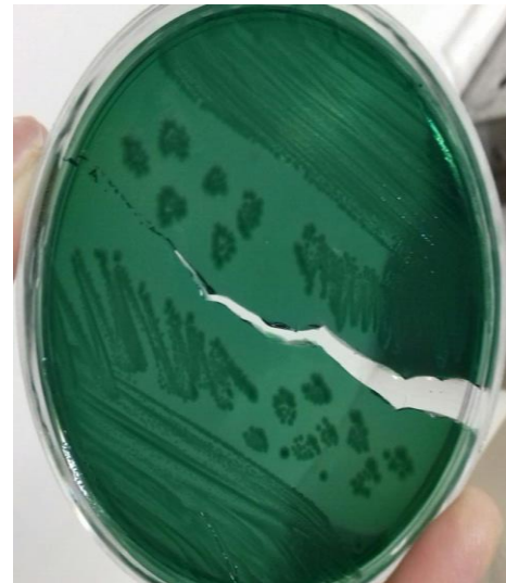
تصویر ۱، کلنی های V.parahaemolyticus بر روی محیط TCBSA