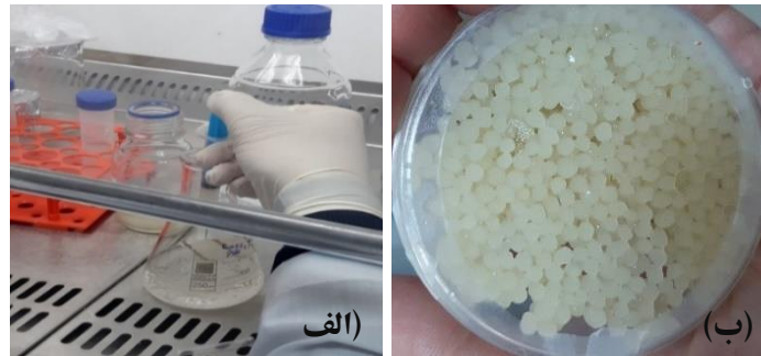
شکل ۱- تصویر آزمایشگاهی مراحل انجام فرایند انکپسولاسیون (الف) و مورفولوژی کپسول های مرطوب (ب).

فرمولاسیون ۱ (آلژینات ۲٪ + پکتین ۰/۵٪) به علت داشتن دیواره سلولی با غلظت بالاتر، زنده مانی بیشتری از خود نشان داد و این بیانگر این امر می باشد که با افزایش غلظت مواد انکپسوله کننده، بازدهی فرآیند کو-میکروانکپسولاسیون بهتر حفظ می شود. لذا در مقایسه با نمونه کنترل، فرمولاسیون ۲ به عنوان نمونه بهینه انتخاب و برای آزمایشات اصلی مورد استفاده قرار گرفت. هم چنین شکل (۱-ب) شمایی از کو-میکروکپسول های تازه سنتز شده را نشان می دهد ( P_{value} < 0.05 ). نمونه های موردنظر در فرم مرطوب دارای اندازه ای در محدوده 1200 \mu m الی 1700 \mu m و نمونه های خشک آن در رنج 300 \mu m الی 500 \mu m بودند [۸].