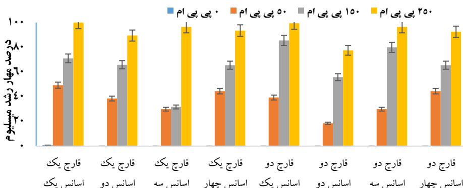
شکل ۳. اثر بازدارندگی غلظت‌های مختلف اسانس‌های زیره سبز (اسانس یک)، اسطوخودوس (اسانس دو)، اکالیپتوس (اسانس سه)، آویشن باغی (اسانس چهار) و توانایی کنترل آنها علیه جدایه‌های قارچی (قارچ یک) F. oxysporum (قارچ دو) F. culmorum .